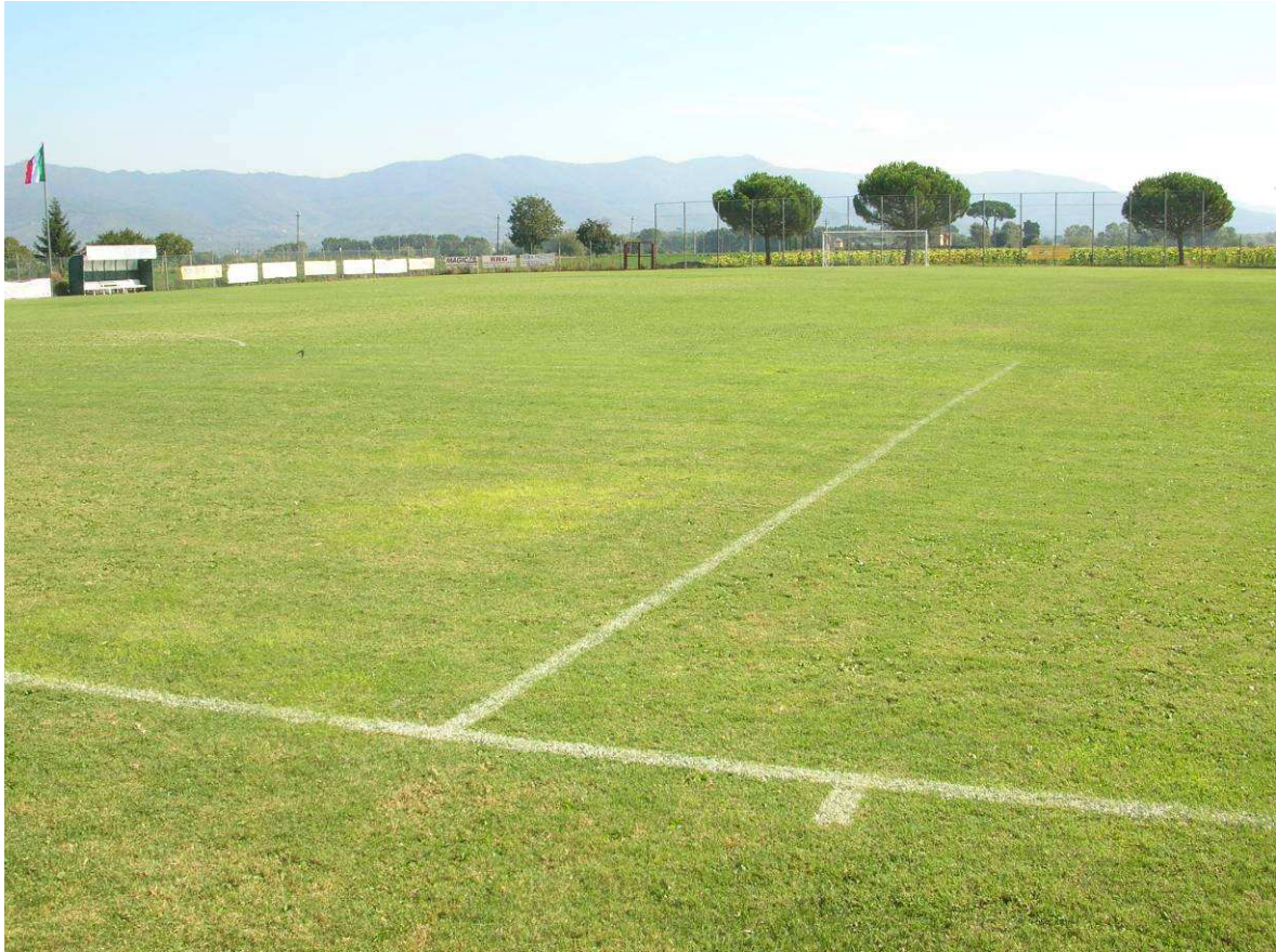
Area Ricovero Popolazione: Campo Sportivo Montagnano