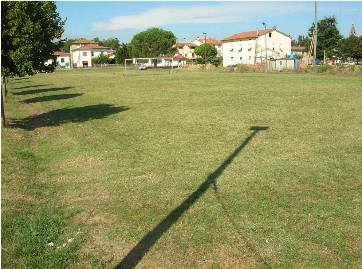
Area Ricovero Popolazione: Campo Sportivo Montagnano