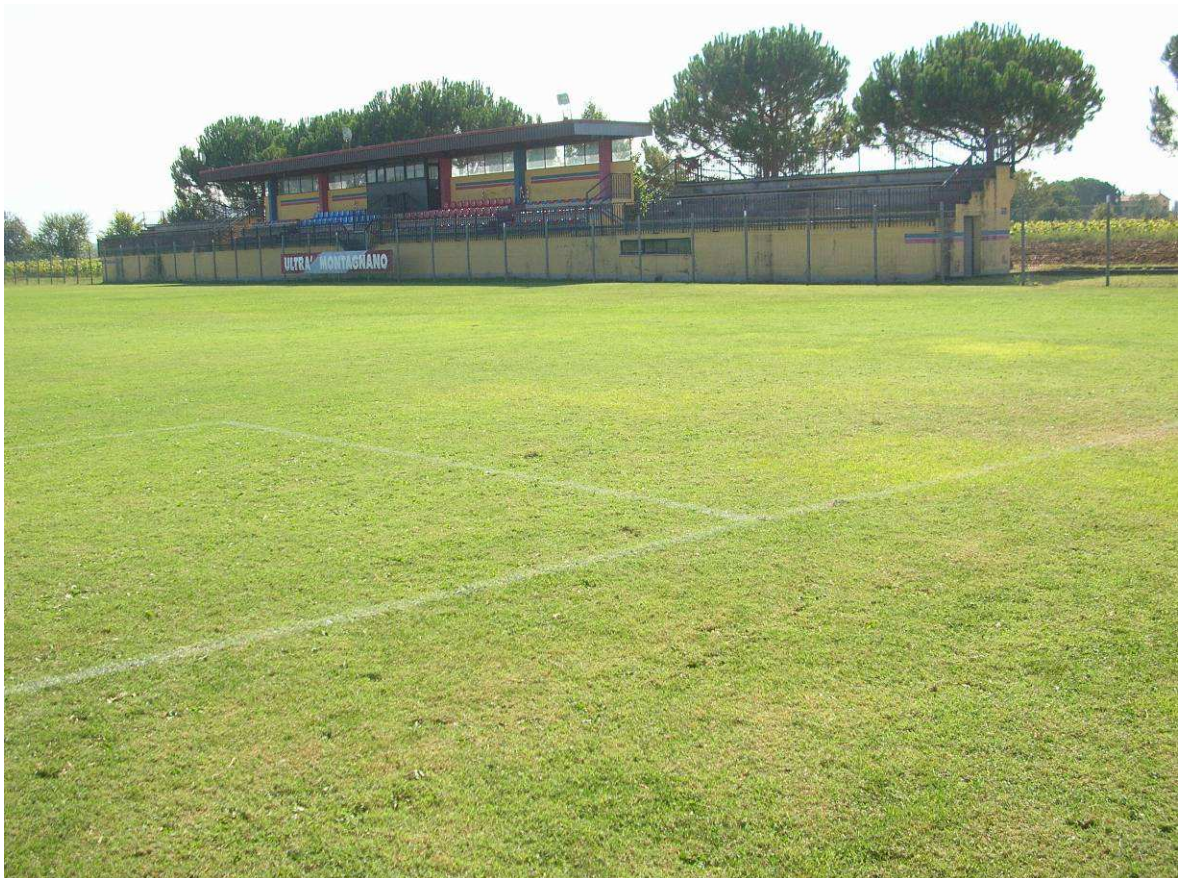
Area Ricovero Popolazione: Campo Sportivo Montagnano