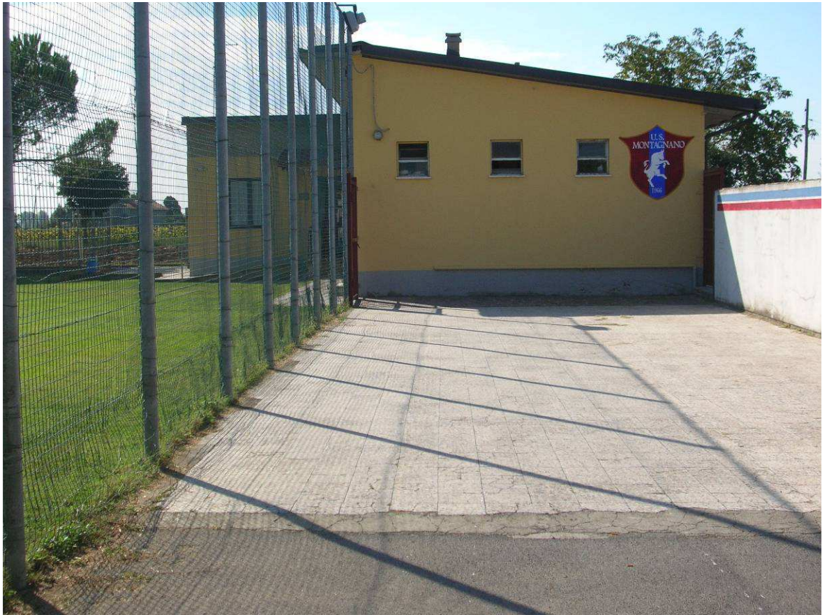
Area Ricovero Popolazione: Campo Sportivo Montagnano