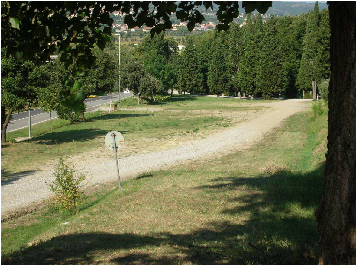
Area Ricovero Popolazione: Parcheggio Santuario Delle Vertighe