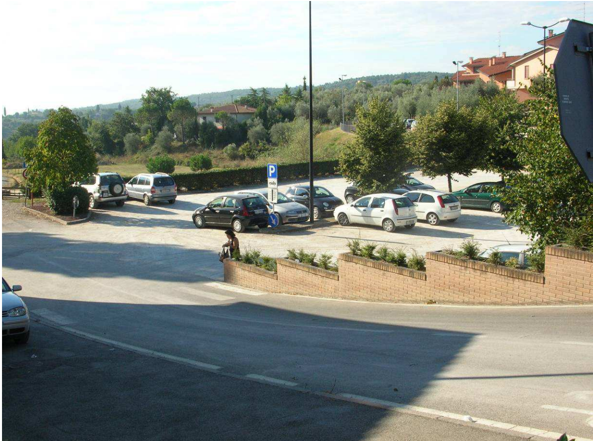
Area Ricovero Popolazione: Parcheggio Casalino