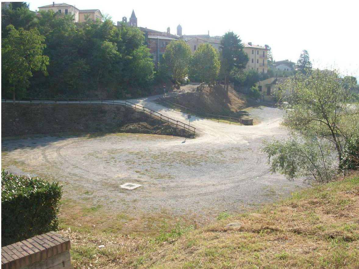
Area Ricovero Popolazione: Parcheggio Casalino