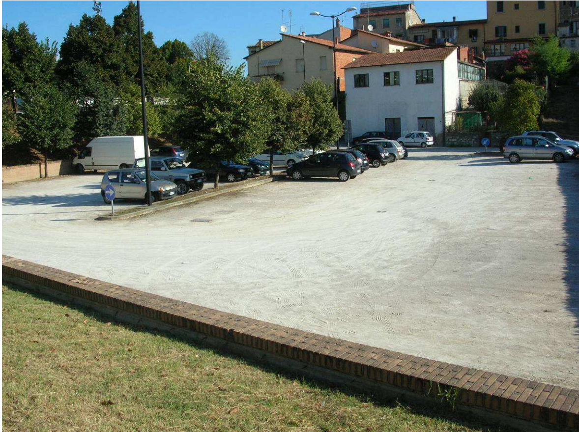
Area Ricovero Popolazione: Parcheggio Casalino