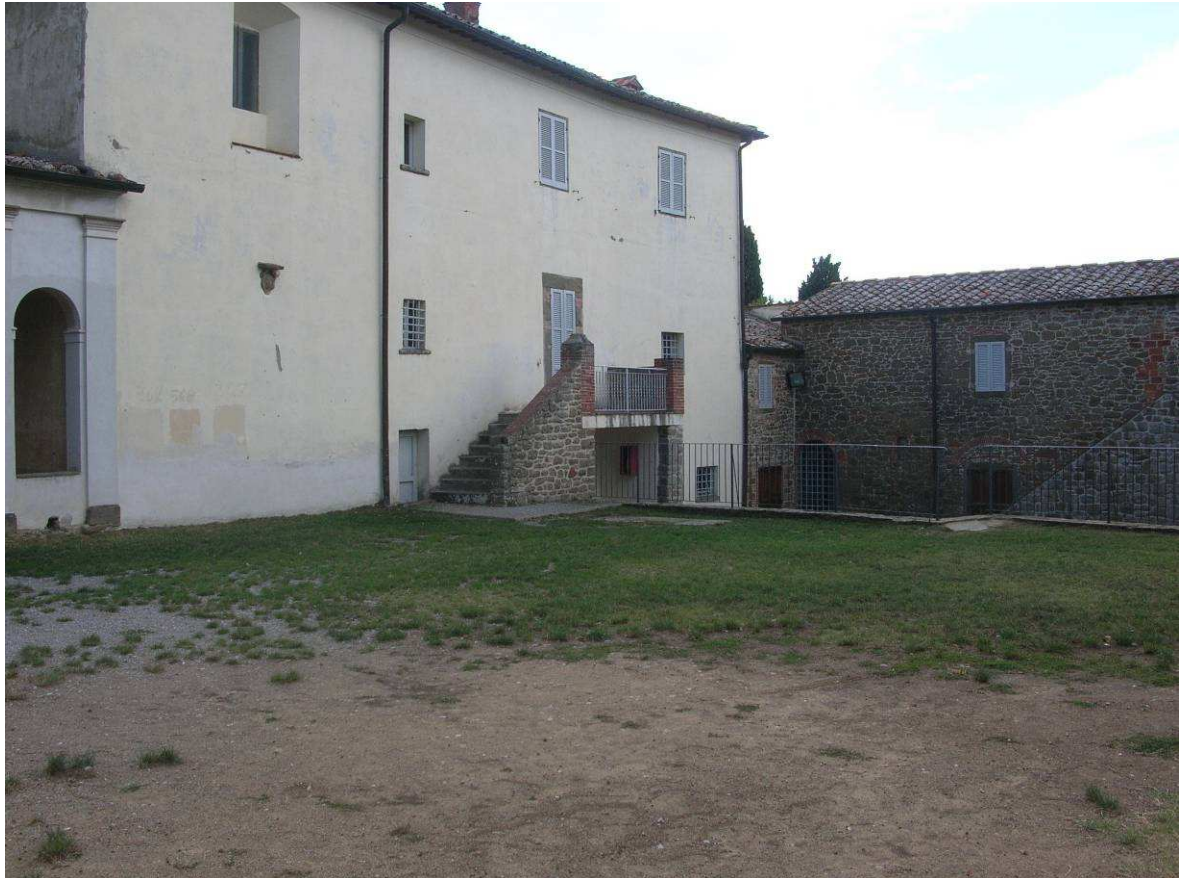
Area Attesa Popolazione: Struttura a servizio dell'area