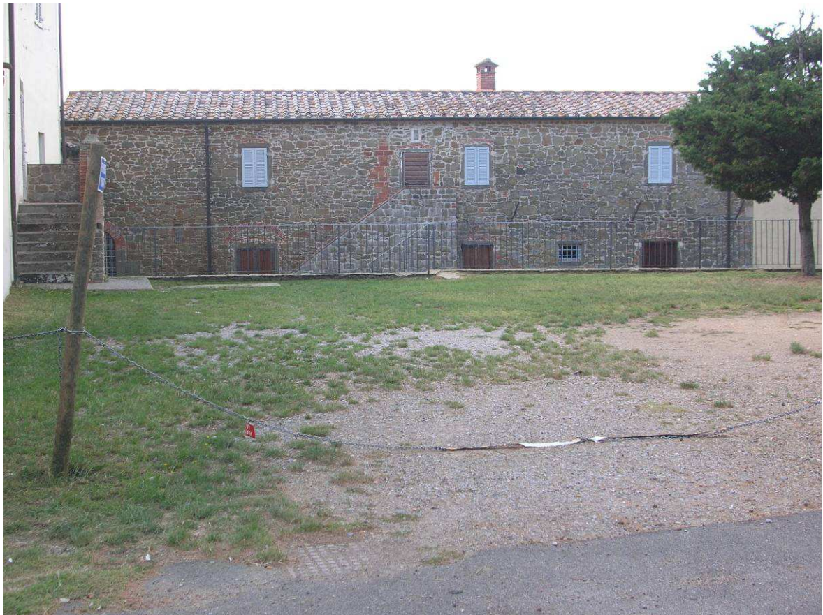
Area Attesa Popolazione: Struttura a servizio dell'area