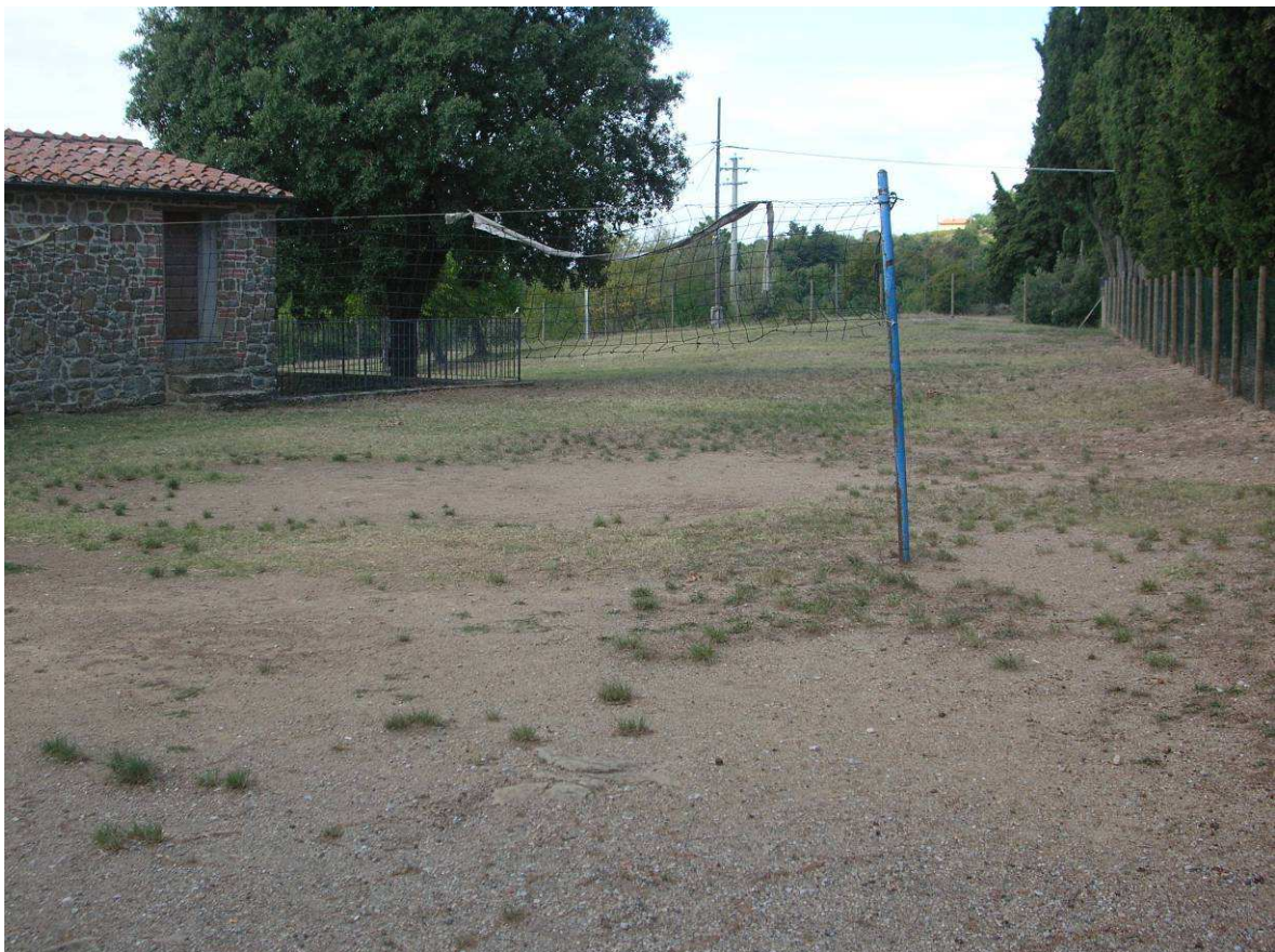
Area Attesa Popolazione: Struttura a servizio dell'area