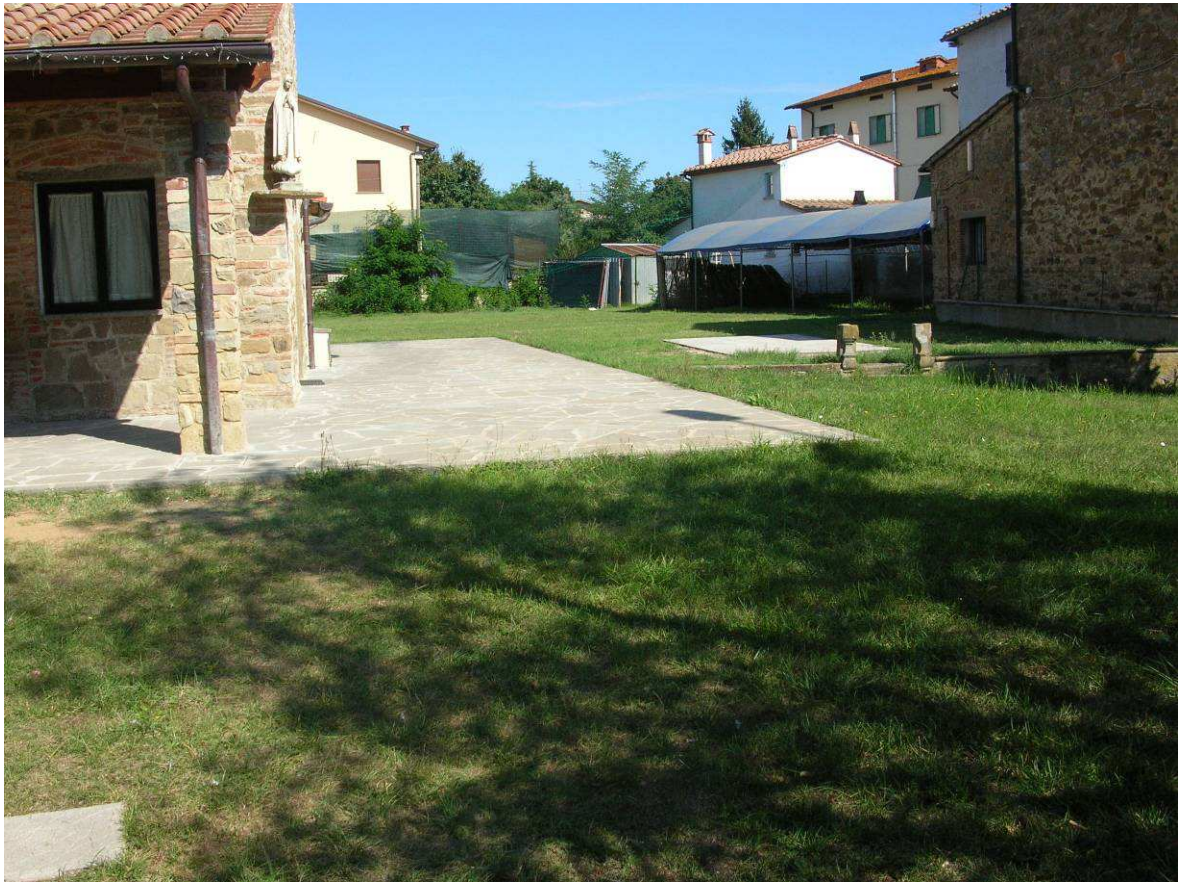
Area Attesa Popolazione: Area Oratorio Chiesa Alberoro