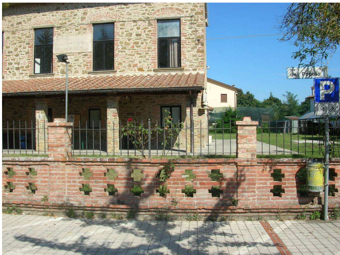
Area Attesa Popolazione: Area Oratorio Chiesa Alberoro